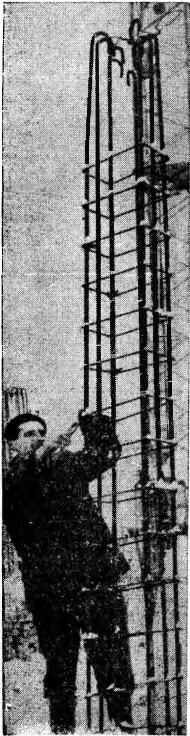
ARMĂTURILE CONSTRUCȚIILOR NOULUI AN... La construcția complexului administrativ al minei Dilja se montează armăturile metalice.