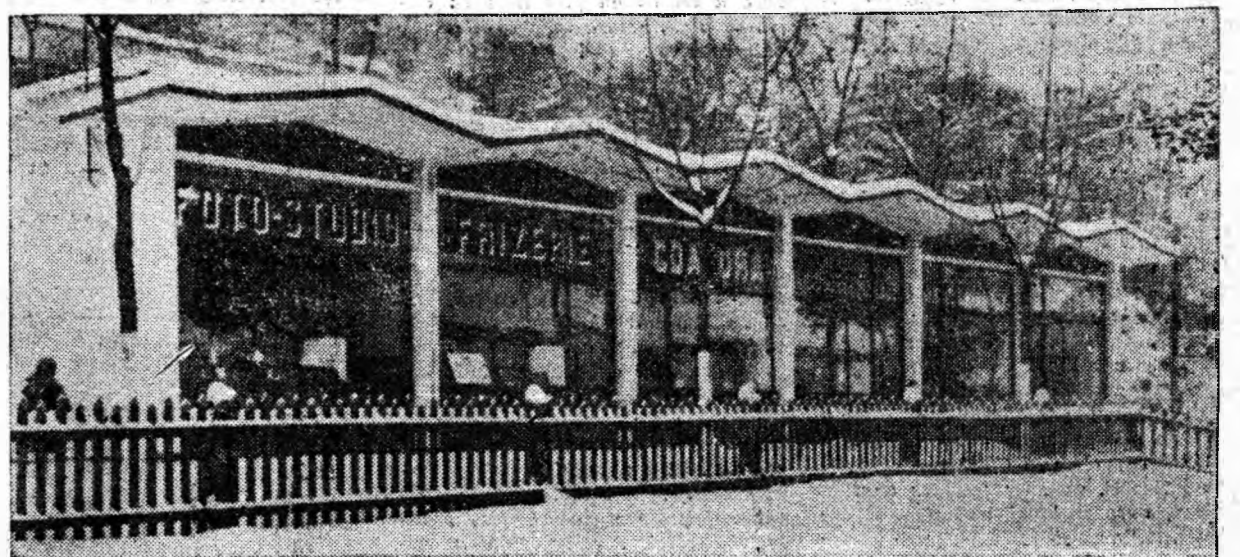
La sfîrșitul anului trecut, la ANINOASA a fost dat în folosință un MICROCOMPLEX DE DESERVIRE (în fotografie) aparținînd de Cooperativa „Jiul”, din Petroșani. Unitatea are secții de radio și televiziune, croitorie, foto, frizerie, cizmărie (reparații), coafură și ceasornicărie.