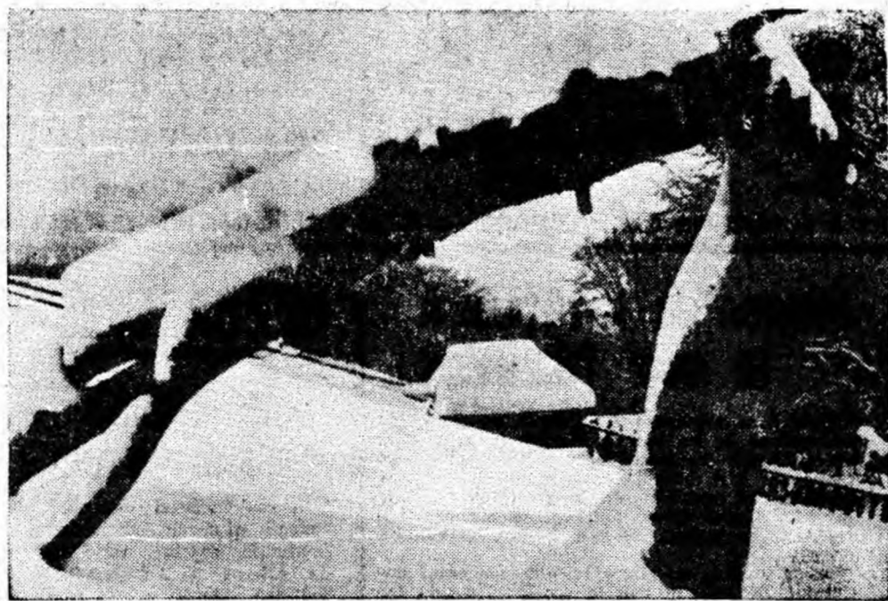
Decor de ianuarie în Paring.

Un concurs asemănător a avut loc duminică pe pârtaile de la cabana I.C.F. din masivul Paring, unde și-au dat întâlnire schiori din Petroșani, Petrila, Lonea.