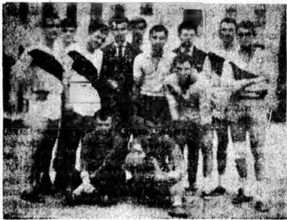
Echipe de handbal Minerul Aninoasa