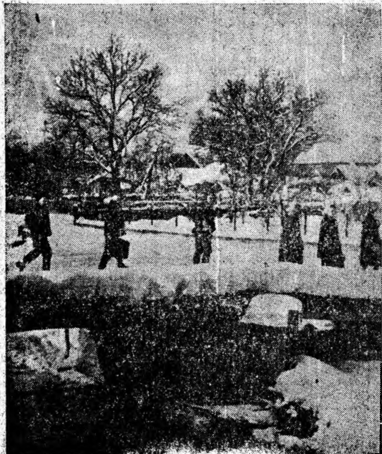
Peisaj de iarnă la Cîmpa