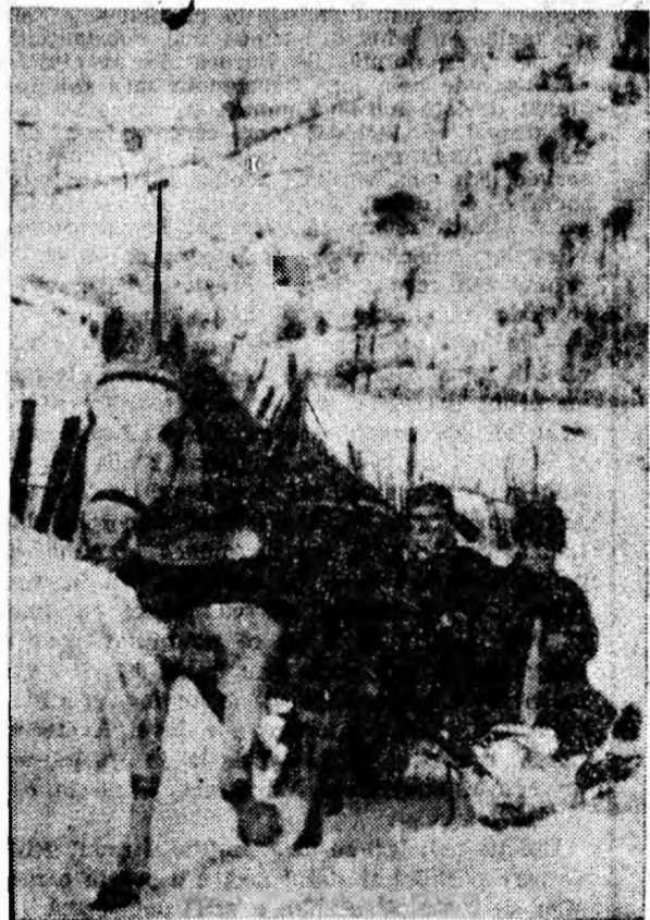
„Dii, căuț cu sânioara mea...”

NICOLAI OSTROVSKI: „Sînt atît de îndatorat față de tineret. Vreau să trăiesc... Trebuie să trăiesc...”