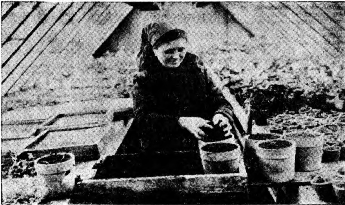
Deși e iarnă, în sera I.C.O. din cartierul Livezeni se plantează zeci de mii de flori. La primăvară ele vor împodobi parcurile și zonele verzi ale orașului.

■ Activitatea obștească de gospodărire și înfrumusețare a orașului se cere împlinită organic cu munca politico-educativă desfășurată pentru păstrarea a ceea ce s-a creat