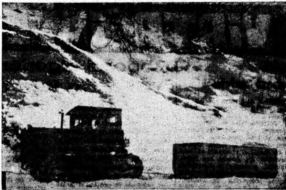
Tractorul își croiește drum prin nămeți. Sonda nr. 17 Dîlța nu va stagna din lipsă de materiale.

Cele câteva exemplificări din rândurile de față sint alte fire rău conducătoare de căldură în apartamentele noastre. Lichidarea acestora va fi numai în favoarea noastră, a celor de la încălzire centrală cu cărbune. Credeți-ne, oameni!