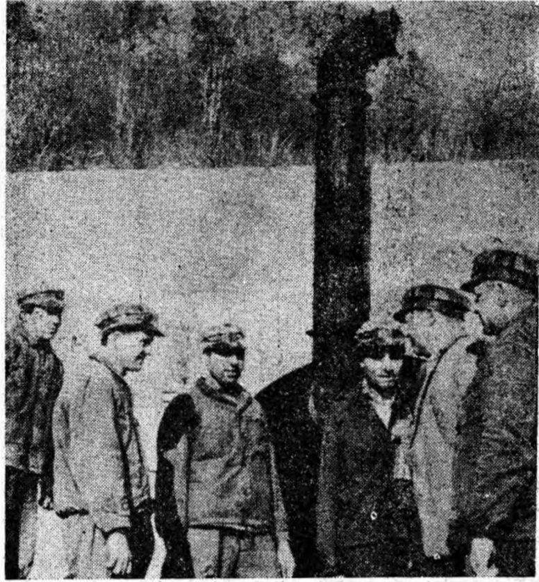
La sfat, mineri și maeștri, în fața celei mai tinere galerii de coastă din Valea Jiului — cea de la viitoarea mină Bărbăteni