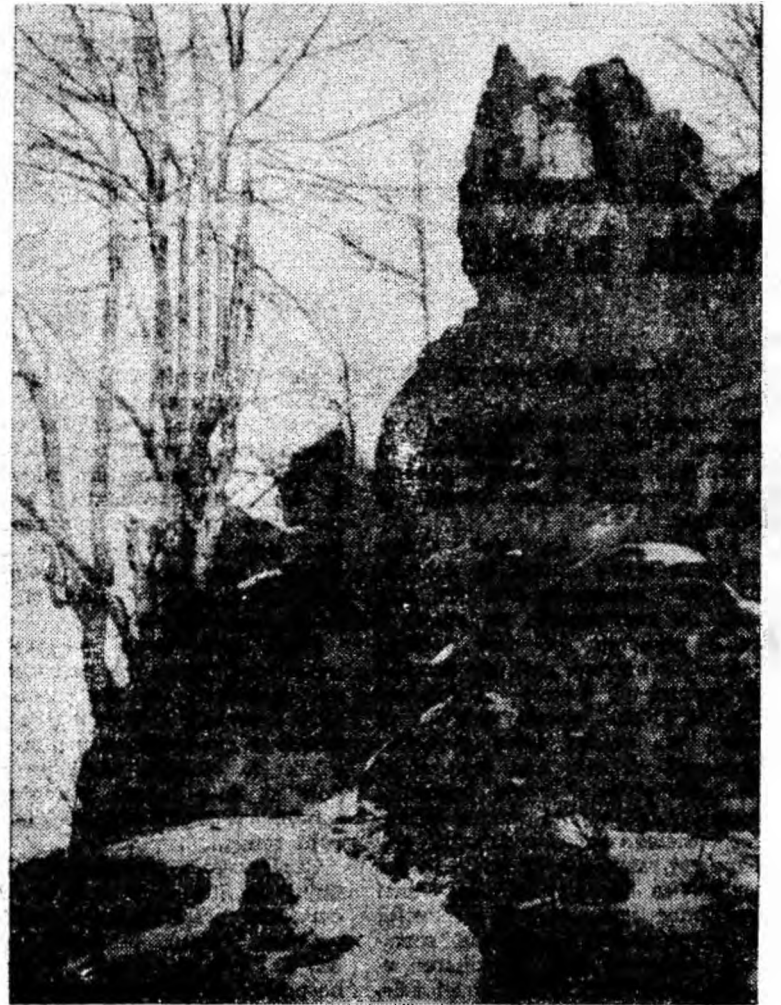
Elemente de decor alpin la Valea Mierleasa