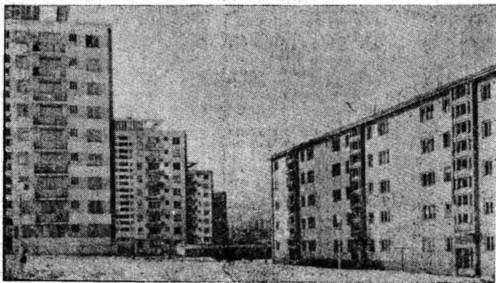
Salba blocurilor moderne se întinde cît cuprinzi cu ochii în Vulcanul de azi.