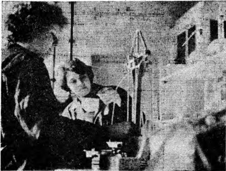
Preparația Coroesti. Aspect din laboratorul de analiza cărbunelui.