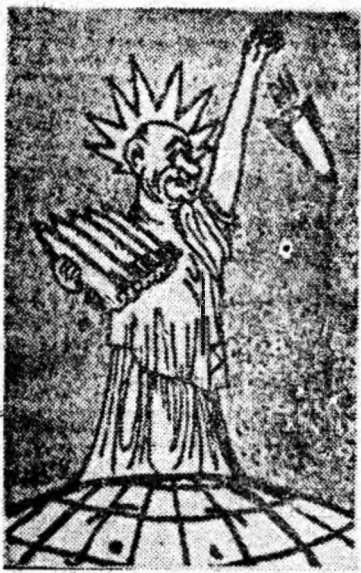
Cum vede ziarul grec „Io Vima”, statuia libertății

opinie publice americane, în vederea găsirii unui candidat pentru „Casa Albă” din Saigon. În ultimii doi ani, Statele Unite au promis să aducă în Vietnamul de sud o „conducere” civilă. Cu toate acestea, zările americane menționează că pentru continuarea războiului la Saigon trebuie ales ca președinte un militar. Corespondentul din Saigon al ziarului „Washington Post” anunță că săptămîna aceasta un număr de zece generali din junta militară de la Saigon au început deja consultările, în vederea stabilirii unui candidat militar la postul de președinte. Observatorii politici americani sînt de părere că principalii candidați sînt: actualul premier, generalul Ky, și șeful statului, Nguyen Van Thieu. Dar orice ar hotărî junta militară, ultimul cuvînt îl are Washingtonul. Ziarul „Washington Post”, citind surse oficiale de la Saigon, scrie că părerea americanilor va precumpani în alegerea candidatului. Astfel, viitorul „ales” în postul de președinte al Vietnamului de sud va fi din nou un om al Statelor Unite care să rămînă obligat guvernului american.