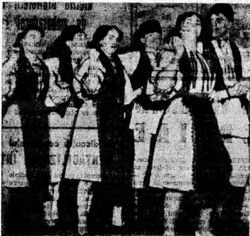
Duminică, la Jieț, în cadrul primei faze a celui de-al VIII-lea concurs, și-au dat întâlnire artiștii amatori din Cîmpa, Bănița și din localitate.

În clișeu: Formația de dansuri din Cîmpa executînd un frumos joc popular localnic.