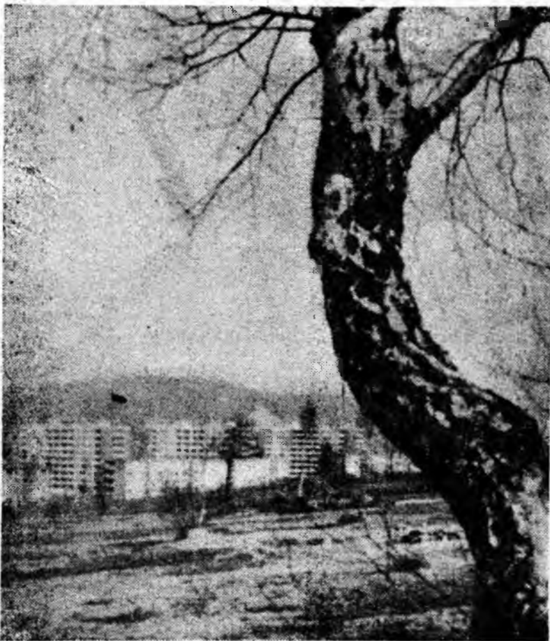
CADRU DIN VULCANUL DE AZI