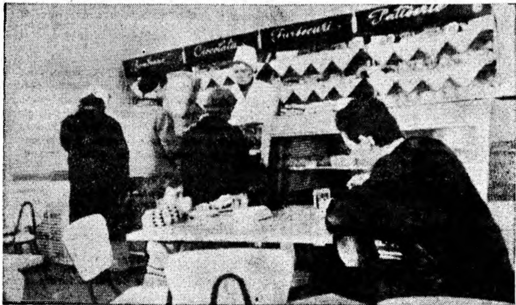
La cofetăria din cartierul Livezeni, deschisă de curînd

PETROȘANI — 7 Noiembrie: Golgota; Republica: Barbă Roșie; PETRILA: În Nord spre Alaska; LONEA — Minerul: Boccaccio 70; LIVEZENI: Procesul de la Nürnberg; ANINOASA: Gustul mierei; CRIVIDIA: Tom Jones; VULCAN: Steaua fără nume; PAROȘENI: Femeta în halat; LUPENI — Cultural: Diligența; Muncitoresc: Moneda antică; BĂRBĂTENI: La ora 5 după-amiază; URICANI: Credeți-mă, oameni!