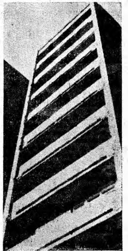
JOCUL LINIILOR CU SPAȚIUL

Și orașul nostru poate și merita o personalitate mai nobilă!