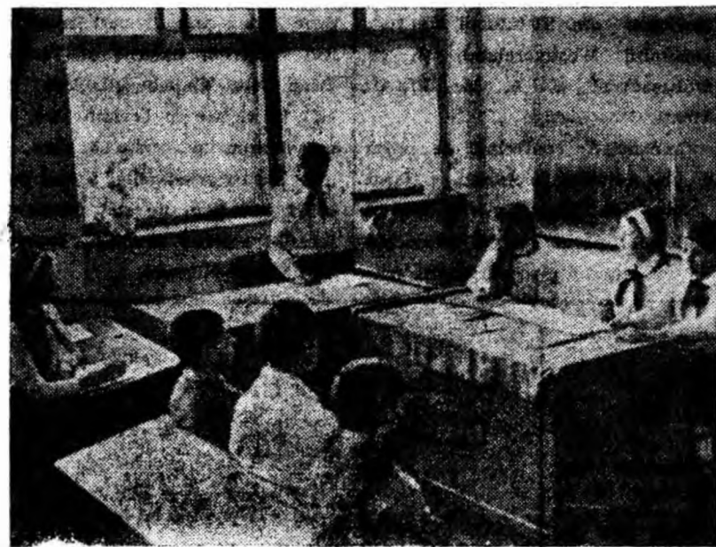
Clasa a V-a B de la Școala generală nr. 5 Petroșani a inițiat o originală formă de discuțare a situației la învățătură și disciplină — „Procesul pionierilor” (în clășeu).