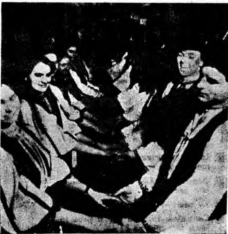
Formația de dansuri a căminului cultural din Cimpa la o repetiție

● Prin volumul „Cuscriitorii prin veac” al lui I. Valerian, Editura pentru literatură pune la îndemina cititorilor o seamă de convorbiri cu scriitorii ce au activat în pe-