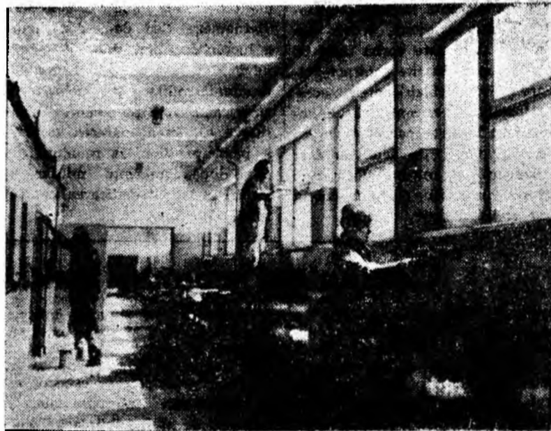
La complexul administrativ al minei Lonea, lucrători de la lotul șantierului T.C.M.M. Valea Jiului execută ultimele finisări