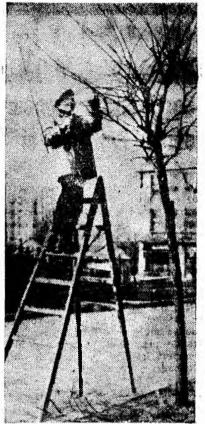
TOALETA DE PRIMĂVARĂ

— Deficiențe avem. Nici în prezent nu stăm bine cu calitatea cărbunelui, la capitolul disciplină, respectarea N.T.S., folosirea deplină a utilajelor și în ceea ce privește ponderea muncitorilor direct productivi în comparație cu cei auxiliari. Comitetele de partid pe sectoare și organizațiile de bază au fost îndrumate să formeze colective care să studieze aceste aspecte economice deosebit de importante. Un colectiv de specialiști, care să studieze posibilitățile de reducere a posturilor neproductive, a fost format și la nivelul exploatării. Măsuri politico-organizatorice am luat multe. Rămîne ca eficiența lor s-o dovedească rezultatele.