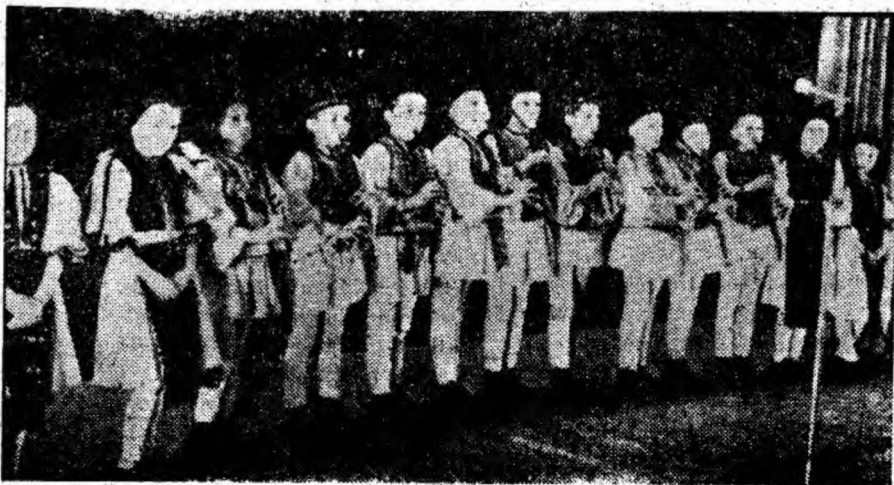
Grupul de fluierași ai școlii din satul Slătinoara, pe scenă