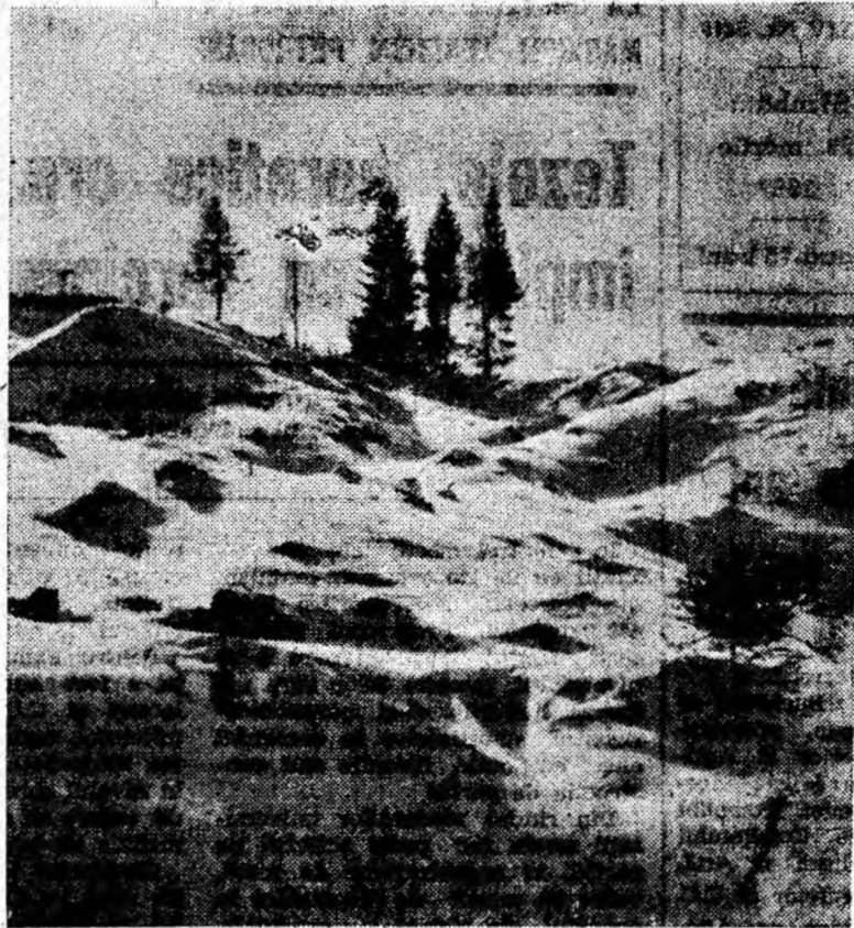
Munții își păstrează încă mantia albă a zăpezii, invitând la drumeție