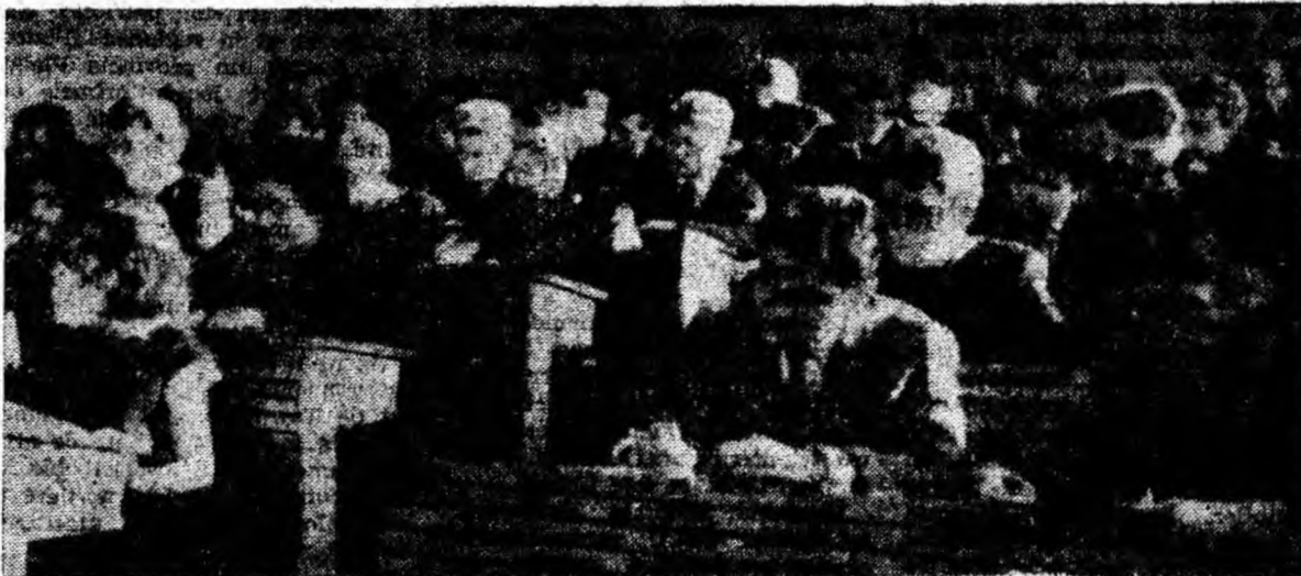
Zi de cursuri la I.M.P.

Pînă la încheierea anului de învățămînt și finerea examenelor a mai rămas puțin timp. Trebuie făcut totul pentru înlăturarea lipsurilor manifestate, pentru ridicarea învățămîntului la nivelul cerințelor.