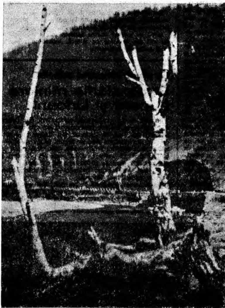
NU MAI E ZAPADA! PRIMĂVARA A VENIT ȘI PE DEFILEUL JIULUI