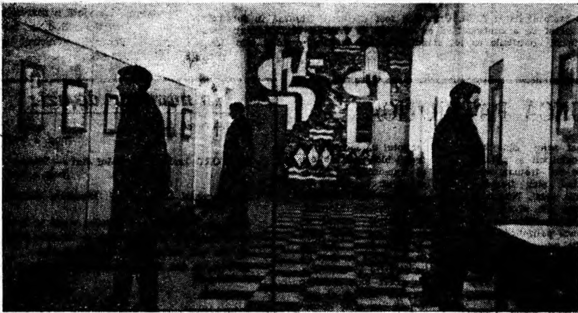
Clubul sindicatelor din Lupeni. În clișeu: aspect din sala expoziției.

Cartea tehnică este un bun mijloc de răspîndire a progresului tehnic. Ea înlesnește introducerea în producție a cuceririlor tehnicii avansate.