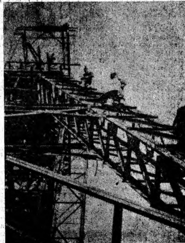
Se lucrează la supraînălțarea vechiului turn al puțului de extracție de la mina Lonea II

O.C.I. Produse industriale Petroșani a pus în vânzare un bogat sortiment de cuverturi importate din R. P. Polonă, fețe de masă, de un colorit plăcut, perdele sintetice și tricotate din fire de bambac, de diferite lățimi, precum și alte mărfuri necesare ornamenteării locuințelor. Aceste produse pot fi procurate de la magazinele textile din Valea Jiului.