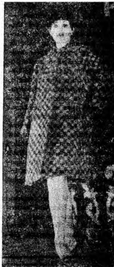
Modele prezentate la Festivalul modei — 1967.