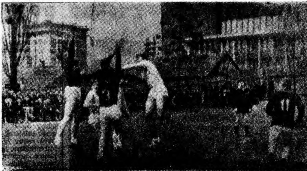
Fază din timpul meciului.