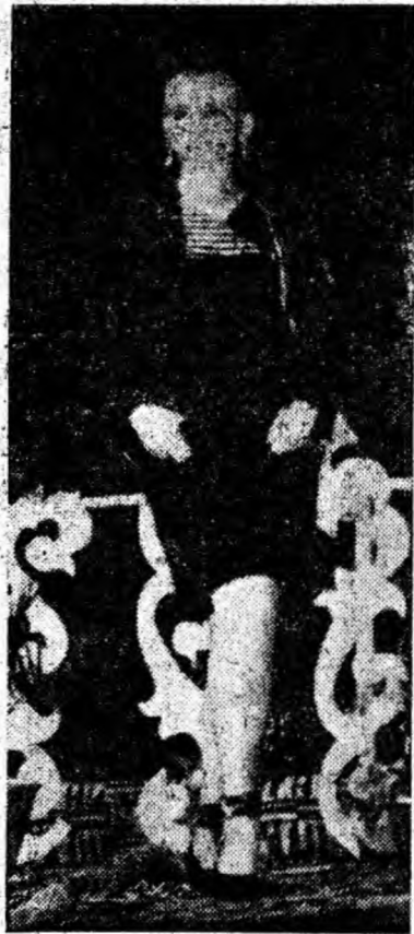
și cele de la „Bega” Timișoara au, în majoritate, croială tip redingotă, cambrate în talie, înguste la umeri, lărgindu-se spre tiv în for-

Rochiile, pardesiile și balonzai-dele pentru femei, produse de fabrica „Mondiala” Satu Mare, cit