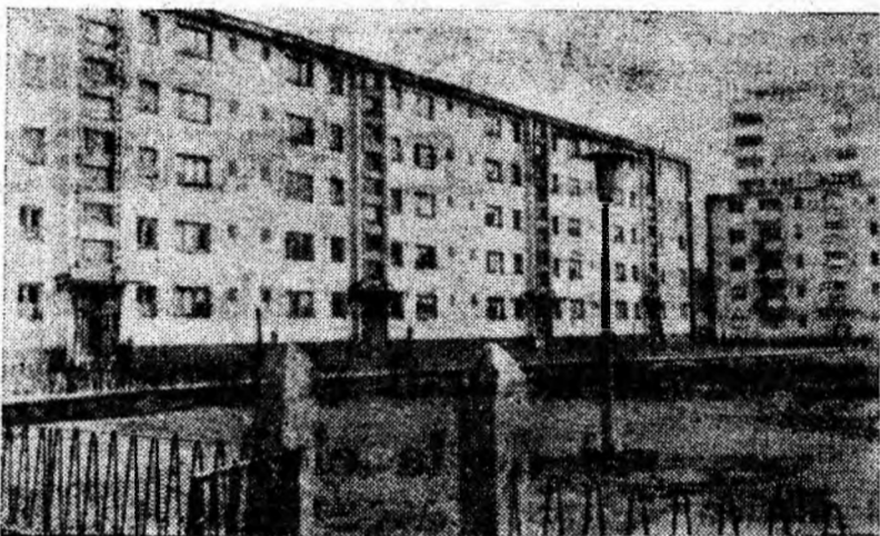
Cîteva din blocurile noului cartier din Petrila

De ce se abat constructorul și beneficiarul de la ele?