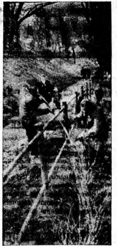
AICI VA CREȘTE UN GARD VIU!