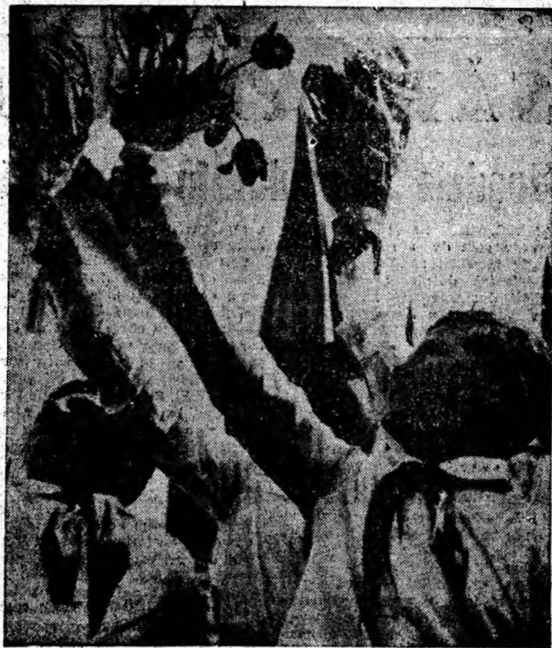
RIDE IARĂȘI PRIMĂVARA