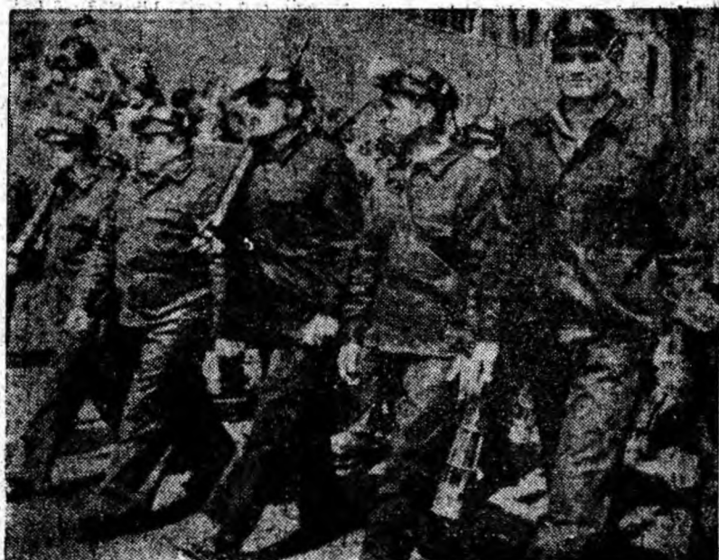
BRAȚE PUTERNICE POARTĂ DRAPELE ROȘII ȘI TRICOLONE. SÎNT BRAȚELE CARE SMULG PĂMÎNTULUI COMORI