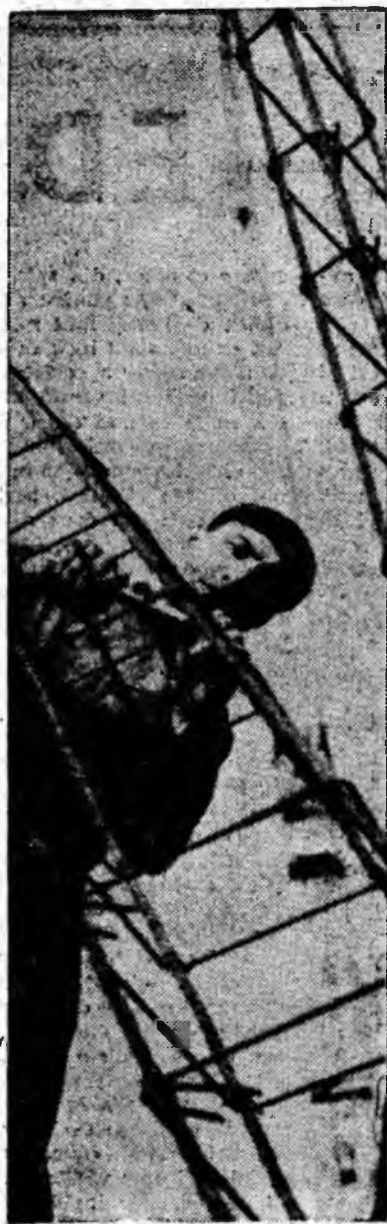
Se montează scheletul metalic al celui de-al treilea bloc turn din micro-raionul A+B Petroșani.