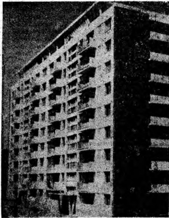
Blocul D 8 din Vulcan în așteptarea locatarilor