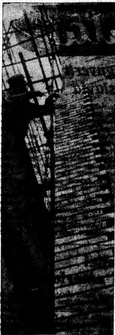
Un nou bloc își îmbracă haina modernă, întregindu-și frumusețea