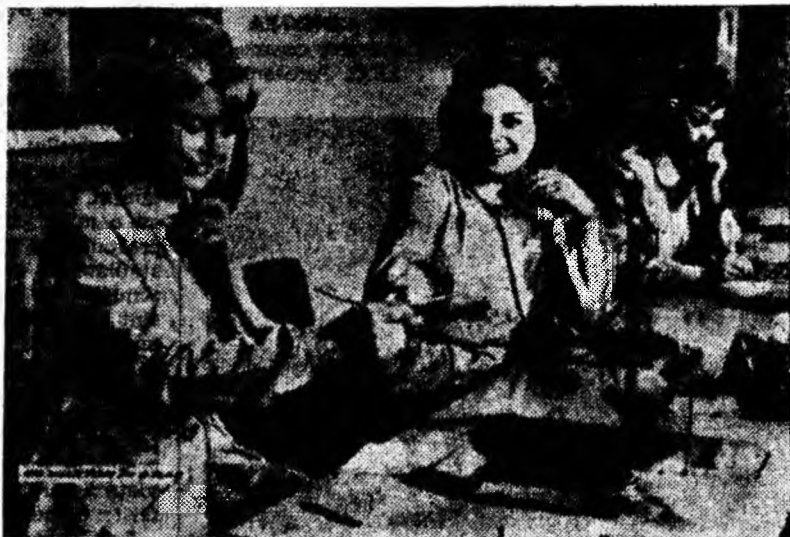
O secvență din filmul „En martor în oray”, o producție a studiourilor franceze, care rulează între 26—30 mai a. c.