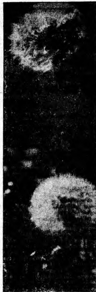
Pe aici n-a trecut nici cea mai ușoară adiere