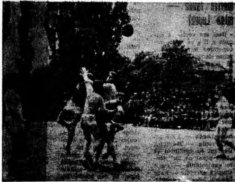
Aglomerare pe semicercul oaspeților. Handbaliștii de la Utilajul vor înscrie încă un punct.

Cele două reprize ale meciului dintre Minerul Aninoasa — Constructorul Hunedoara au fost dic-