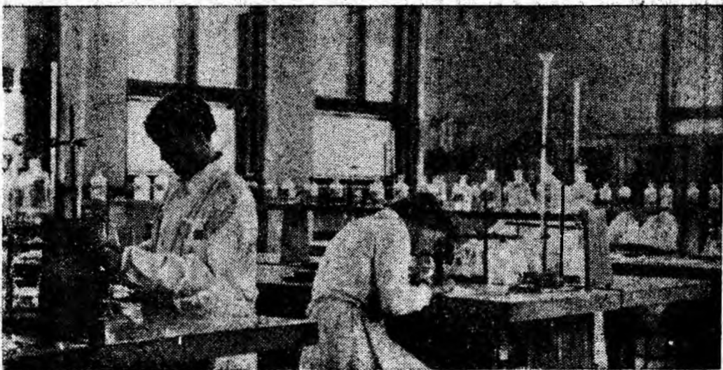
Studenti la o oră de practică în laboratorul de chimie analitică al I.M.P.