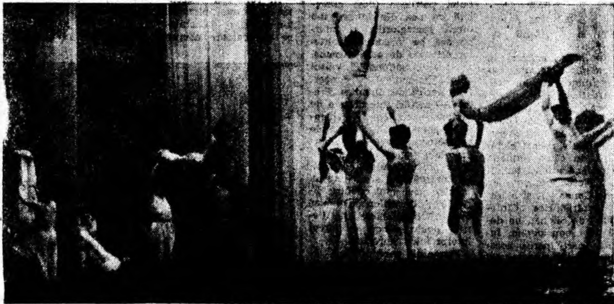
Pasivă cu activitatea joasă, mulți elevi învață și alfabeta gimnastică. Iată-i pe cîțiva într-un moment exercițiu pe scena Casei de cultură din Petroșani.

„Vulturii” reprezentanți ai rugbiului de la „Jiul” în campionatul categoriei B nu s-au desmințit. Au pierdut și de data aceasta pe teren propriu cu 0-3 în fața timișorenilor. E o „performanță” să nu cîștigi nici un meci de-a lungul unui întreg campionat. Adică nu. Au cîștigat și juluștii unii... la Cluj prin neprezentarea echipei locale. Bine că din categoria B nu se suspendă. În schimb se cheltuie bani și aici.