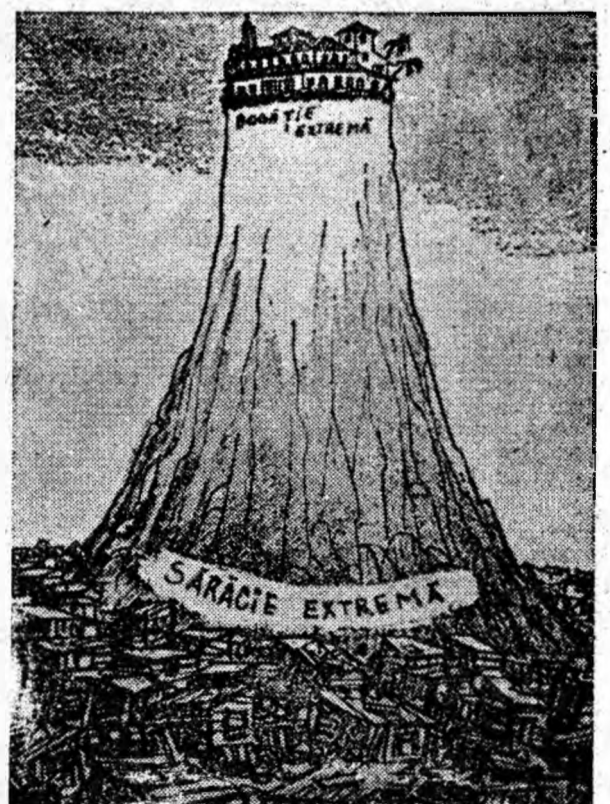
CONTRASTE LATINO-AMERICANE („New York Herald Tribune”)

Un grup de veterani de război americani au publicat în ziarul „New York Times” un apel chemînd la încetarea agresiunii S.U.A. în Vietnam. Semnatarii apelului cer să se pună capăt bombardamentelor împotriva R. D. Vietnam și cheamă la organizarea unei demonstrații a veteranilor de război la Washington.