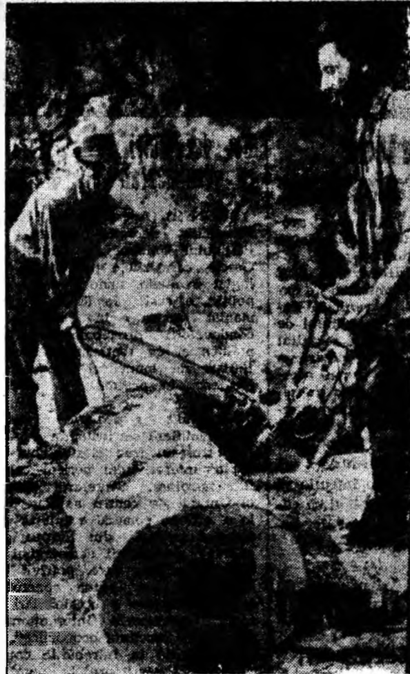
Mecanizarea a pătruns și în sectorul forestier Roșia, unde secționarea buștenilor se face cu fierăstraie mecanice