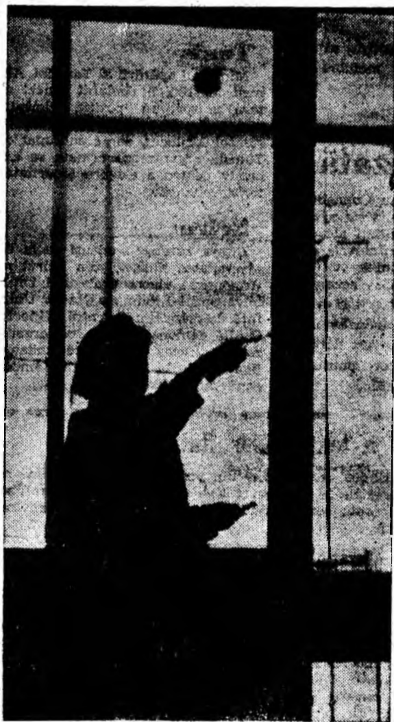
SILUETE LA GEAMURI

Înscrierile se fac pînă în prețuia examenului la stația Petroșani, unde se pot primi și informații suplimentare. Pe durata școlii, elevii primesc o bursă lunară de 612 lei, iar după absolvire vor primi uniforme gratuite și permise de călătorie gratuită pe C.F.R. pentru ei și familie.