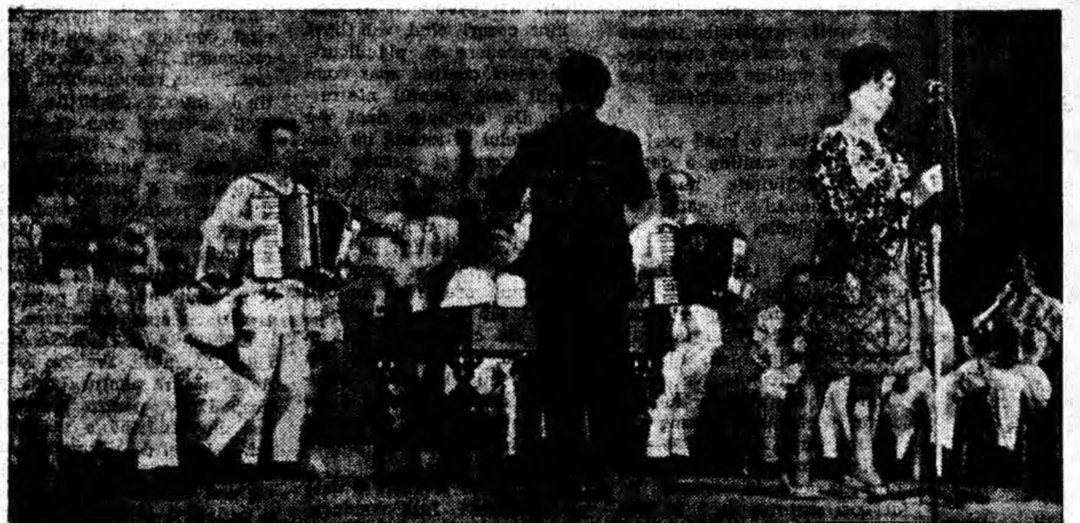
Aspect de la unul din rezultatele spectacole date de formația artiștilor amatori din Uricani.