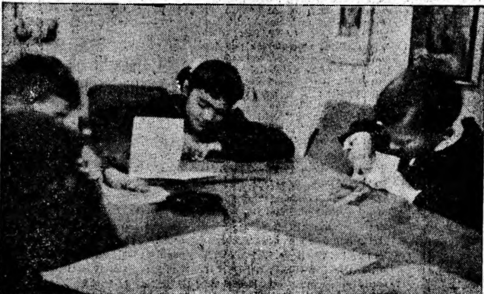
Creatori de frumuseți! La clubul din Lupeni micii gravori sînt captivați cu totul de munca lor.

În vederea contractării cu comerțul pentru anul 1968, la I.O.I.L. Petroșani se află în pregătire un nou prototip de cameră combinată. Noul tip de mobilită se va compune din următoarele piese: un recamier, un dulap cu trei uși, o bibliotecă combinată cu vitrină și patru scaune. Mobila va avea un aspect elegant, modern.