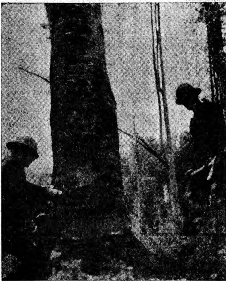
De la această operație începe drumul lemnului