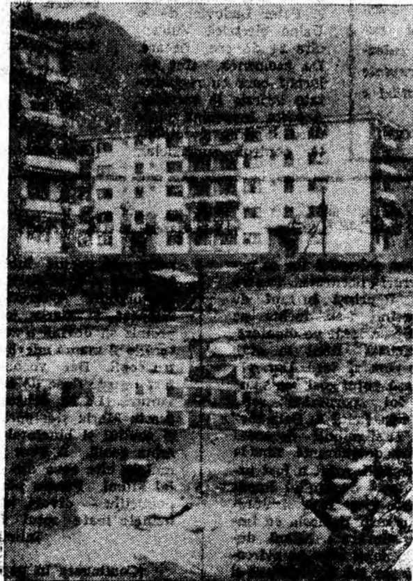
Pe Aleea Narciselor din Lupeni, frumosul şi simţul gospodăresc al locatarilor făc casă bună (fotografia de jos). În cartierul 8 Martie din Petriţa însă, blocurile elegante sînt reflectate de „oglinzi” bălţilor neglijenţei (fotografia din dreapta).