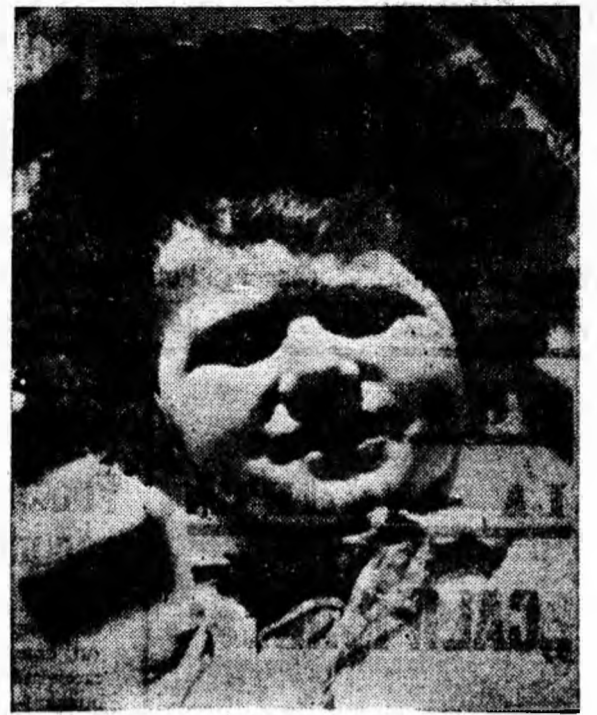
Zîmbet senin, spre soare