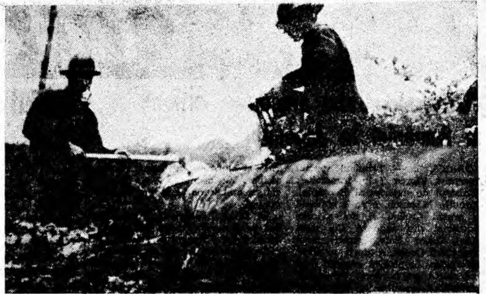
Se sortează și se secționează buștenii în exploatarea forestieră Rășcoala