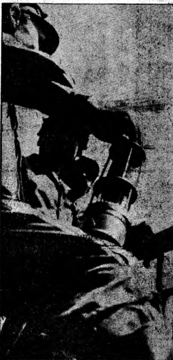
La mina Lupeni, un nou schimb se pregătește să coboare în subteran. În privirile minerilor se citește hotărârea de a smulge adâncurilor noi cantități de cărbune.