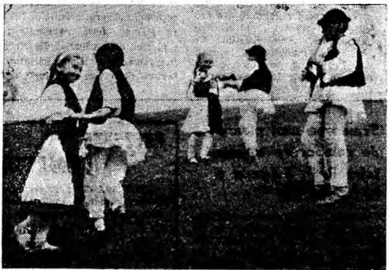
Joc de doi, pe pajiștea inverzită de la Răscœala.

După cum am mai anunțat, a II-a etapă a campionatului regional de box pe echipe se va desfășura în ziua de 11 iunie la Cugir. Din Valea Jiului vor fi prezenți la întreceri 11 pugiliști. Ei vor avea ca parteneri pe reprezentanții orașului Hunedoara. Cei 11 boxeri din Valea Jiului au plecat azi dimineață spre orașul metalurgistilor din Cugir.