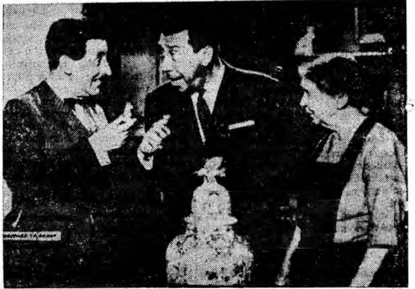
IN CLIȘEU: O secvență din filmul „Relaxă-te, dragă!”.

denelor preocupate de psihanaliză. Hélène va avea astfel revelația nebuniei de care se înconjurase, iar calmul și fericirea își vor relua locul în familia Faustin. Filmul cu ascuțite accente satirice, interpretat de actori de prestigiu ca Fernandel, Sandra Milo ș. a. rămîne totuși o comedie boulevardieră de o valoare discutabilă. Filmul este interzis tinerilor sub 16 ani.