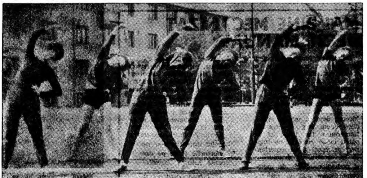
Exercițiile de gimnastică în aer liber sînt un excelent reconfortant și, totodată, un mijloc de întărire a sănătății.

Intr-un număr viitor al ziarului nostru vom expune exercițiile pentru femeile care stau mult în picioare — mai ales pe loc.