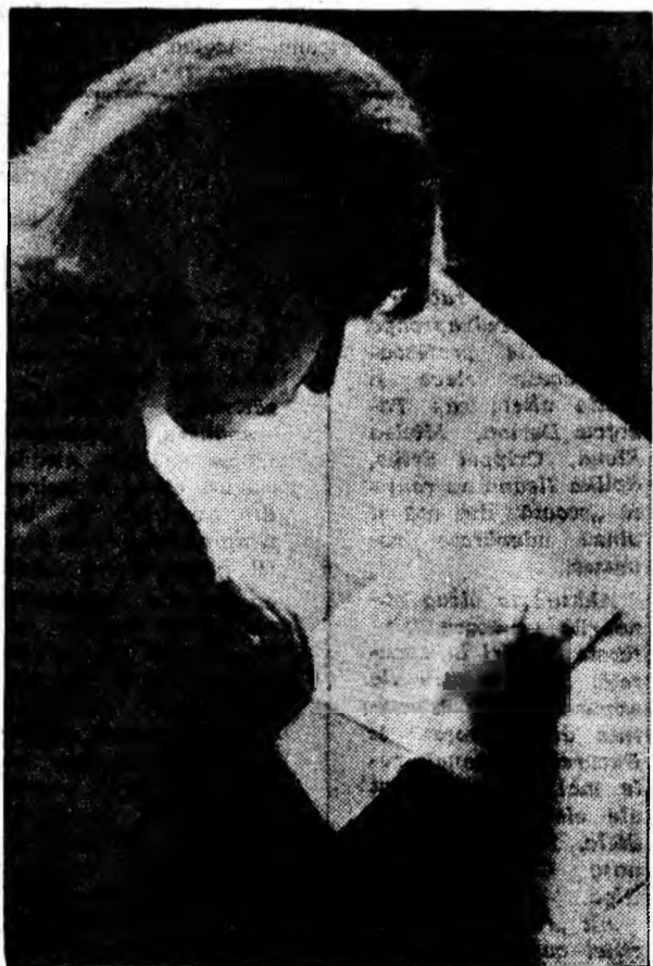
Concentrarea și atenția asigură un răspuns clar și concis

Pagină realizată de M. CHIOREANU și V. TEODORESCU