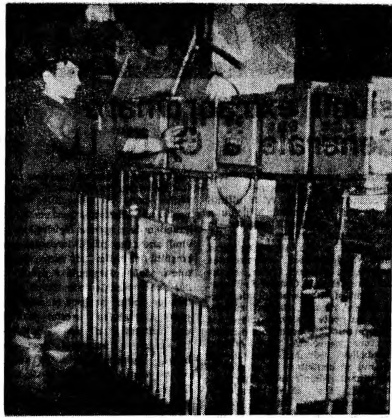
De la aceste tablouri de comandă, prin simple apăsări pe butoane, se pun în funcțiune utilajele care separă și spală cărbunele în secția de spălare a preparației Coroești.

PROGRAMUL I: 6,00 RADIOJURNAL. Sumarul presei; Sport; 6,20 Radio-publicitate; 7,00 RADIOJURNAL. Sport; 7,45 Sumarul presei; 8,00 Tot înainte; 8,20 MOMENT POETIC; 8,25 La microfon, melodia preferată; 9,30 „De la munte, la mare” — program muzical; 10,10 Curs de limba spaniolă; 10,30 Lucrări muzicale inspirate din istoria patriei; 11,00 BULETIN DE ȘTIRI; 11,03 REVISTA REVISTELOR ECONOMICE; 11,15 Parada soliștilor și a orchestrelor de muzică ușoară; 12,00 Formațiile Alexandru Avramovici și Roger Danneels; 12,15 Miorița; 12,35 Muzică populară interpretată de Victoria Baciu; 12,45 Am ales pentru dumneavoastră aceste melodii; 13,00 RADIOJURNAL; 13,13 Succese ale muzicii ușoare; 13,30 Intîlnire cu melodia populară și interpretul preferat; 14,00 Fîrcele de cîntec românesc;