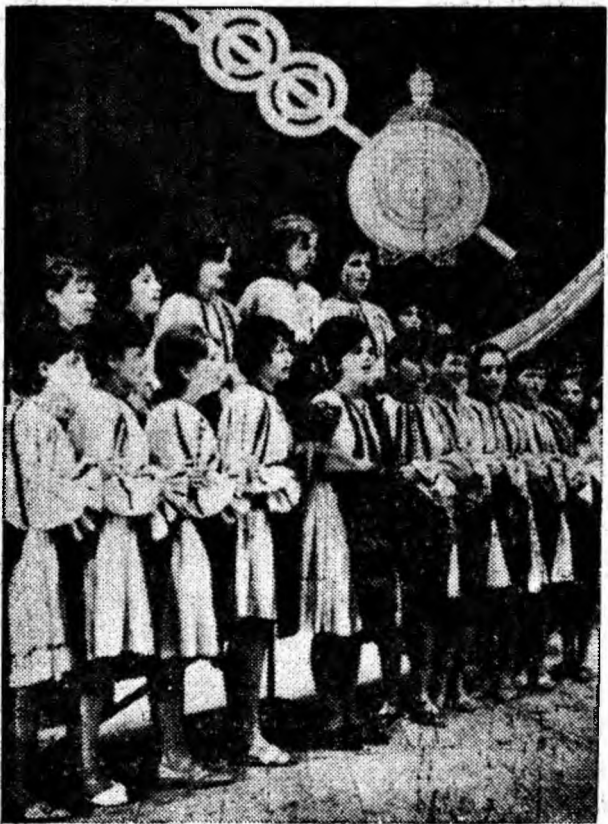
Grupul vocal de la clubul sindicatelor din Vulcan