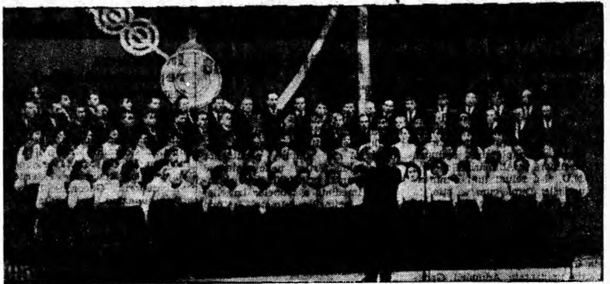
Corul clubului sindicatelor din Petrila, una din revelațiile fazei regionale.