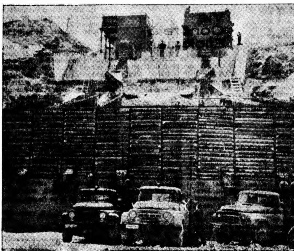
S-au terminat lucrările de montare a noii stații de zdrobire și sortare a calcarului de la cariera Bănița. Capacitatea stației este echivalentă cu munca manuală a 100 de muncitori.

La ghidajele metalice dreptunghiulare de la pușturile cu șabip