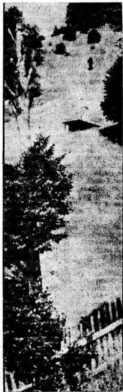
Un crîmpei din pitorescul peisaj ce te întîmpină la tot pasul, mergînd pe noul drum forestier ce duce spre Aușelu.