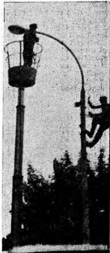
Doi electricieni se cațără pe verticala stîlpilor de beton. Ei montează lămpi fluorescente pentru iluminat străzile orașului Petroșani.

În domeniul tehnic, maistrii, șefii de echipă, revizorii tehnici și șefii de garaj vor controla cu exigență calitatea reparațiilor în atelierele autobazei și la coloane. S-au preconizat măsuri eficiente și în ceea ce privește asigurarea din timp a pieselor de schimb necesare, urmărirea zilnică de către șefii de coloană a stadiului îndeplinirii sarcinilor de plan. Organizațiile de partid, sindicat și U.T.C. vor desfășura muncă politico-educativă de întărire a disciplinei, de folosire integrală și cu eficiență economică maximă a timpului de lucru.