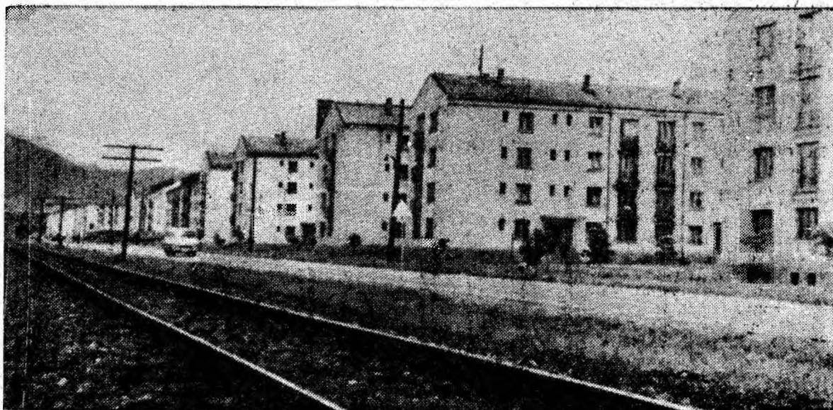
La intrarea pe „poarta” dinspre sud a orașului Petroșani