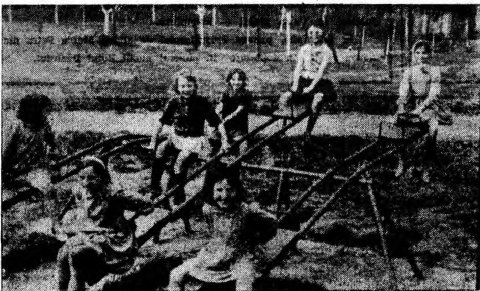
Distracții de vacanță

Am spus la început că, vorbind de perle, omul se gîndește la podoaabe. la ceva frumos, strălucitor. În contrast flagrant cu această imagine, „perlele” pescuite de noi nu numai că nu împodobesc pe cei care le-au așternut pe hîrtie dar, citîndu-le, te revoltă „curajul” cu care elevii respectivi s-au prezentat la examene. Asemenea „perle” provoacă indignare. Lipsa evidentă de pregătire, înseamnă un blam pentru autorii lor.