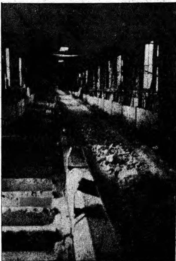
Banda de șist de la puțul auxiliar nr. 1 al minei Dilja