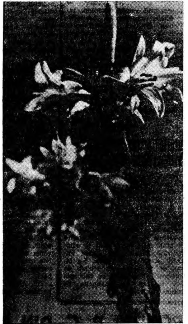
Crinii — simbolul verii — au înflorit