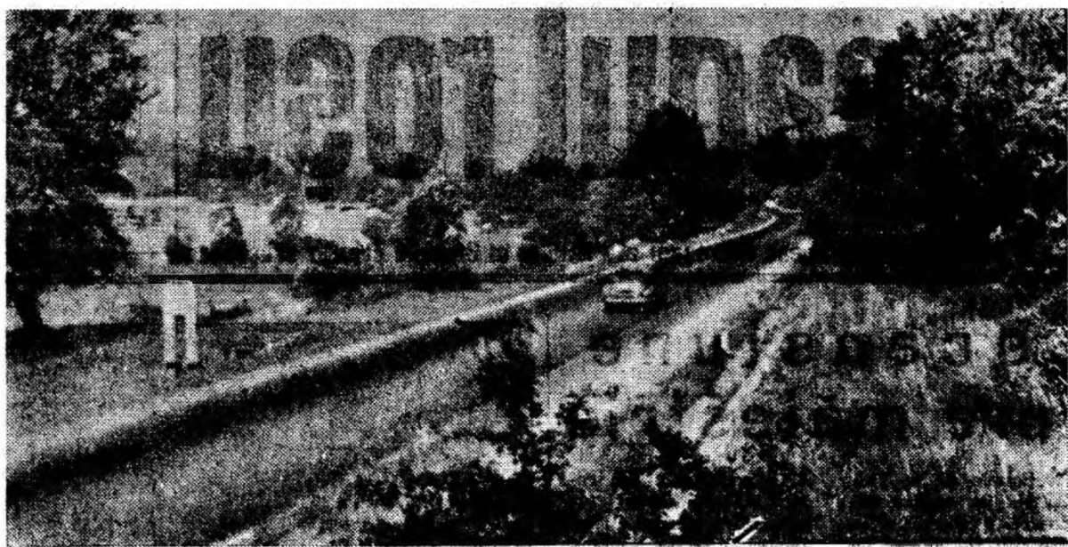
VARĂ LA LIVEZENI