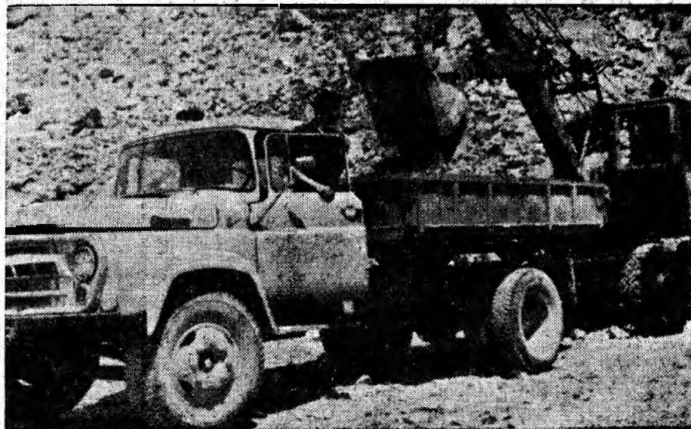
MECANIZARE LA CARIERA DE CALCAR DIN BANIȚA

pentru două persoane importate din R. S. Cehoslovacă, hamacuri, biciclete Tohan-7 și truse de voiaj care se vînd cu preț redus.