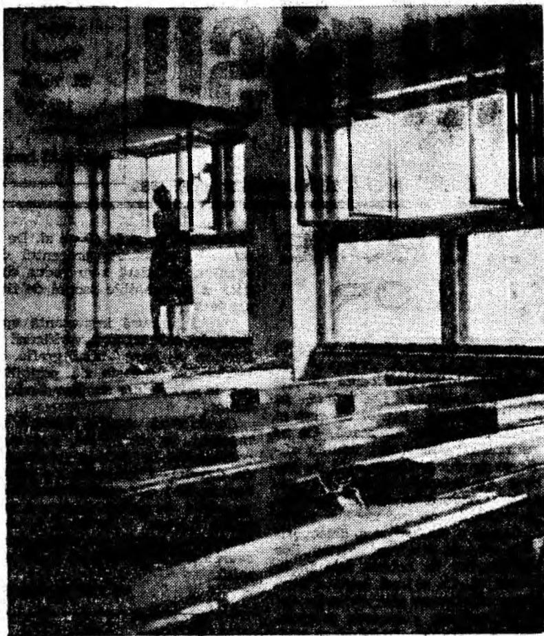
Școala generală nr. 5 Petrila. Actul final al pregătirilor pentru noul an de învățământ: curățenia generală în sălile de clasă.

Declaratiile făcute de cadrele competente cărota ne-am adresat au confirmat faptul că, în toate școlile din Valea Jiului lucrările de reparație și amenajare sînt pe sfîrșite, că la 15 septembrie a. c. elevii vor fi primiți în clase curate, cu manualele noi pe bănci putînd să-și înceapă activitatea școlară în cele mai bune condiții.