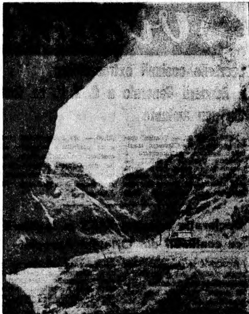
La Cheile Tăii apa și-a fierăstruit în decursul milenilor cale să coboare spre bătrînul Jiu. Oamenii au construit însă în scurtă vreme un drum forestier frumos și bun. Mare satisfacție și bucurie pentru excursioniștii motorizați, dar și pentru pedestri.